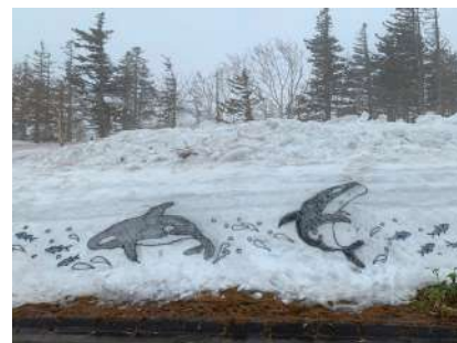
雪壁に描かれたシャチ

4月13日に羅臼町の[雪壁ウォーク]に参加しました。最高9mの雪壁は見上げると首が痛くなるほど高かったです。帰り道は霧も晴れて、羅臼岳や連山も眺められました。翌日は、全身筋肉痛でしたが、久々に体を動かして気持ちよかったです。