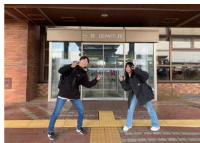
きっかけプロジェクト、出発前の様子